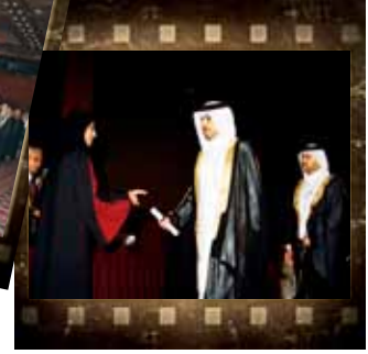
حفل تخريج الدفعة الثامنة والعشرين بفندق الشيراتون بتاريخ ٢٠٠٥-٠٦-٢٠