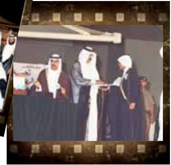
حفل تخريج الدفعة التاسعة عشر من طلاب جامعة قطر بتاريخ ١٩٩٦-١١-٢٣